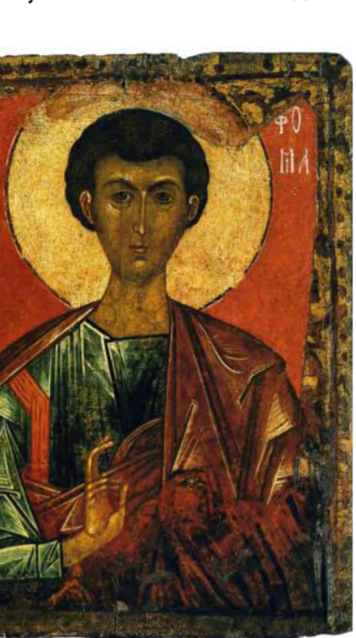
Апостол Фома. Изображение из альбома Булкина В. А. «Русская икона». СПб.: Аврора, 2008.

броненосный исполин, вооруженный бесчисленными средствами разрушения и смерти, и разукрашенная яхта царя и вельможи, назначенная для торжественных и увеселительных поездок.