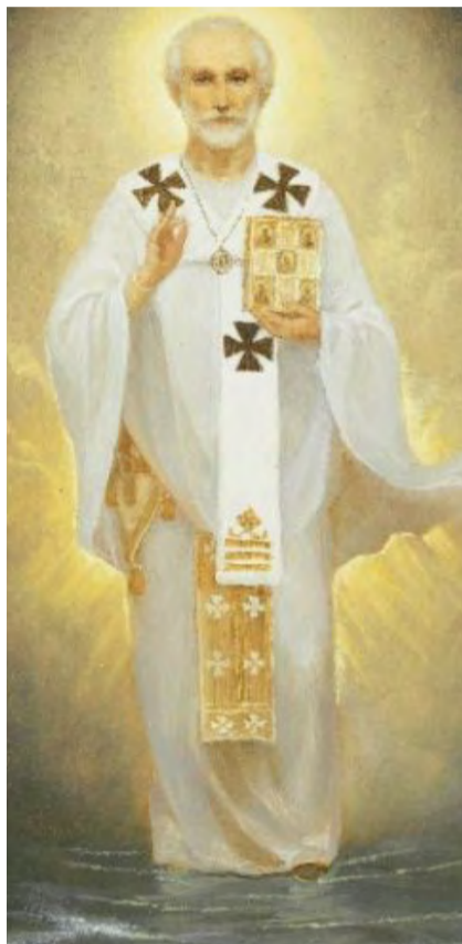
Святитель Николай Чудотворец. Фрагмент картины. Иконы с изображением святого имеются в храмах Лысьвенского благочиния.