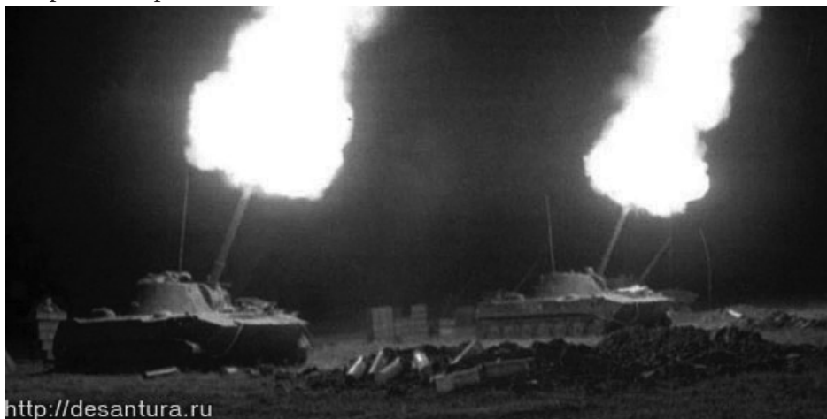
Батарея 120-мм самоходок ВДВ вёдет огонь.

Близлежащие воинские подразделения минут десять любовались самодельным фейерверком, устроенным артиллеристами нашего десантного батальона.