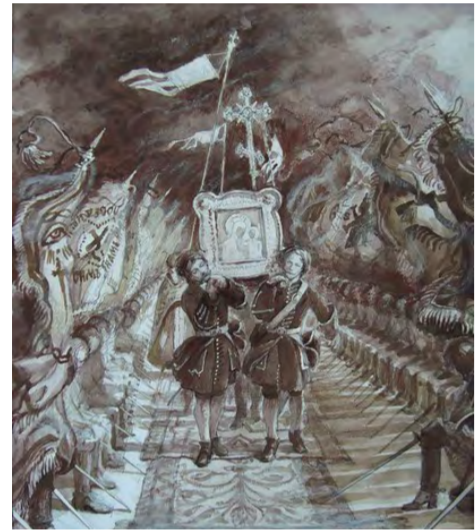
Пронесение иконы Божией Матери сквозь полки русского строя перед Полтавской битвой 27 июня 1709г. Рис. художника Евгения Пупри. Тогда наши войска разгромили шведскую армию.

Продолжение. Начало на стр. 1. В 1709 году накануне Полтавской битвы Петр молился со своим войском перед Казанской иконой, и им была одержана победа. В 1812 году этот же образ осенял русских воинов, отражавших нашествие французов. И именно 22 октября русские войска нанесли противнику первое крупное поражение.