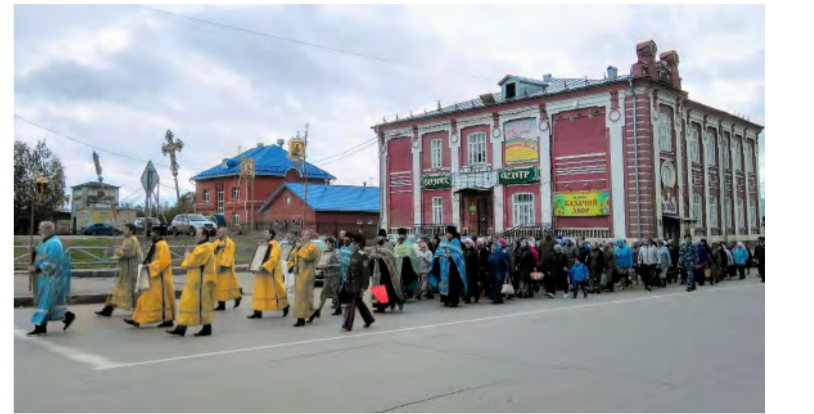
Лысьва. 21 сентября 2019 года. Традиционный крестный ход в честь Пресвятой Богородицы по улицам города.

будет всегда, до последнего часа и мгновения жизни мира. И наше веру у ю щ е е , знающее великую силу ходатайства Матери Божией сердце пусть всегда припадает к ногам Божией Матери со своими воздыханиями, нуждами, скорбями, во всех испытаниях и в минуты плача о грехах. И Она, Радость всех скорбящих, наша Небесная Мать, простирая Свой Держав-