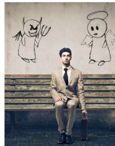
Не осуждай! Поэтому в христианстве нет понятия «хороший человек».

Но если мы обратимся к христианской этике, мы увидим еще более загадочную картину. Дело в том, что в христианстве вообще нет понятия «хороший человек». Ни в одной из двадцати семи книг Нового Завета это словосочетание не встречается ни разу.