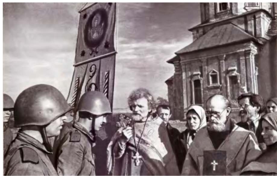
После Курской битвы. Жители г. Дмитровск-Орловский встречают красноармейцев, вступивших в освобожденный город.

Явилась икона 2 марта одной крестьянке в селе Коломенском под Москвой. На иконе в руках у Матери Божией были царские скипетр и держава. И сказала Она, что отныне Сама будет охранять Россию. И теперь в России царство не от мира сего. Теперь вместо Царя руководит страной Мать Божия. И мы с вами ощущаем на себе Ее Державный Покров и заботу о русском народе.