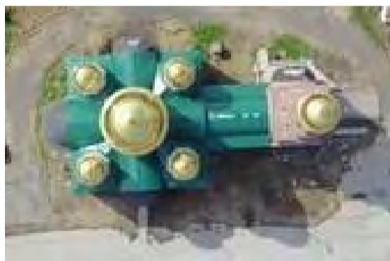
Уникальная фотография. Лысьвенский храм во имя Святой Троицы с высоты 300 метров.

Прежнее название улицы Коммунаров – Церковная. Соответ-