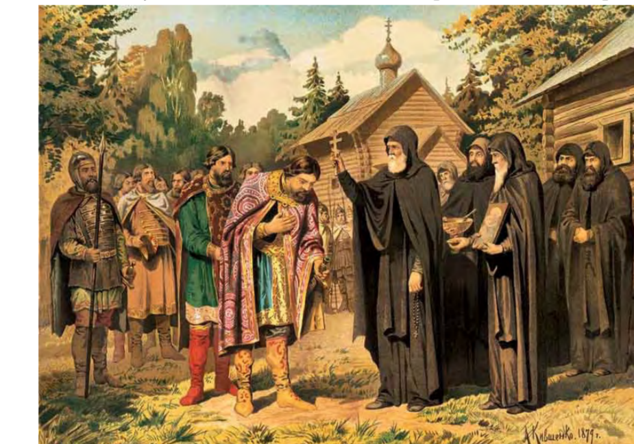
Алексей Данилович Кившенко. «Преподобный Сергей Радонежский благословляет московского князя Дмитрия Ивановича на битву с Мамаем». 1874 г.

пределение обязанностей между монахами. За духовным развитием своих подвизников преподобный Сергей следил с неустанным вниманием, стремясь к тому, чтобы каждый инок занимался тем делом, к которому был близок и по характеру, и по способностям. Ученики, вступающие на стезю