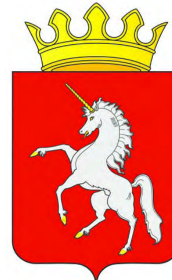
Лысьва - единственный город в России с единорогом в гербе.

заводы отмечали свою продукцию особым клеймом с главным символом рода - единорогом. Так было и с Лысьвенским горным округом, которым в своё время владели Шуваловы. На листовом железе Лысьвенского завода, пользовавшегося большой популярностью на мировом рынке, ставилось клеймо с изображением головы единорога. Поэтому возвращение единорога в Лысьву и началось с завода. Сначала он вновь появился на продукции, выпускаемой ОАО «АК ЛМЗ», на документах завода. С 17 июня 1998 года появляется рядом с названием корпоративной газеты «За передовую металлургию». А через месяц с небольшим Лысьвенская городская дума ставит окончательную точку в истории его возвращения.