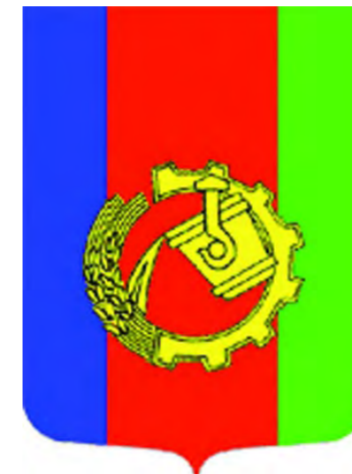
Лысьва. Советский герб.

Первый официальный герб Лысьвы как территории был утверждён городским Советом в 1985 году. Он разрабатывался с 1984 года при участии самодеятельных художников. Основа этого герба - геральдический щит, разделённый по верти-