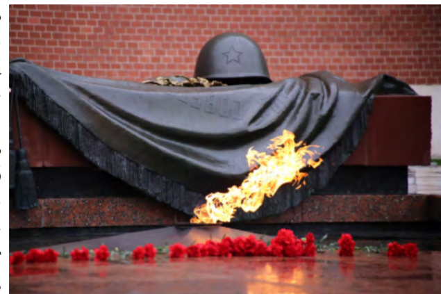
Москва. Лысьвенская каска на Могиле неизвестного солдата.

«Имя твоё неизвестно, подвиг твой бессмертен», - надпись на мемориале. И «Бессмертным полком» идут от здания драмтеатра