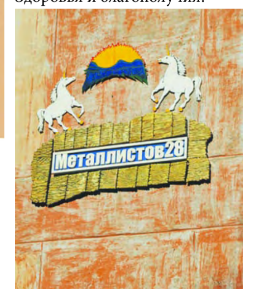
Лысьва. Гербовые единороги на фасаде многоквартирного дома.