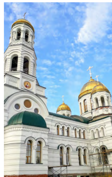
Лысьва. Трёх престольный храм в честь Святой Троицы, Николая Чудотворца и лауреата Сталинской премии святого Луки Войно-Ясенецкого.

на железнодорожный вокзал 17 тысяч наших земляков, призванных на фронты лысьвенским военкоматом. Играет оркестр. - С Богом! - шепчут им вслед провозающие. Наши защитники волнуются, ищут глазами родных... Спасибо, вам, лысьвенцы! Мы помним ваши боевые и трудовые подвиги!